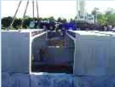
An Tulcha #1

Leanadh ar aghaidh leis na hoibreacha ar an Tulcha i gContae na Mí agus i gContae Bhaile Átha Cliath sa bhliain 2006. Ceann de na príomhghnéithe ar ghlac foireann Cothabhála Draenála Réigiún an Oirthir de chuid Oifig na nOibreacha Poiblí uirthi féin ab ea athsholáthar Dhroichead Loch Salach idir Cluain Aodha agus Dún Búinne, Co. na Mí. Obair mhór a bhí anseo mar is léir ó na grianghraif a thaispeántar thíos.