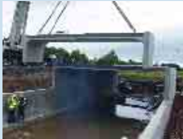
An Tulcha #2

Tosaíodh obair mhór thógála i bPáirc Uí Ghríofa, Cathair Bhaile Átha Cliath chun bunchloch a chur faoi bhalla atá ann cheana féin ach a bhfuil go leor dochar déanta dó le blianta beaga anuas agus a bhí mar bhonn taca ag líon áirithe tithe ar bhruach deas na habhann.