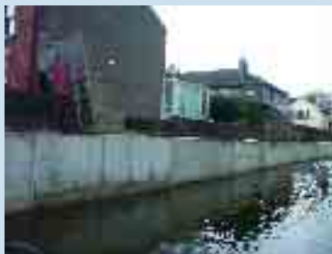
Páirc Uí Ghríofa #2