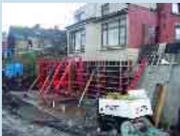
Páirc Uí Ghríofa #1

Tosaíodh obair mhór thógála i bPáirc Uí Ghríofa, Cathair Bhaile Átha Cliath chun bunchloch a chur faoi bhalla atá ann cheana féin ach a bhfuil go leor dochar déanta dó le blianta beaga anuas agus a bhí mar bhonn taca ag líon áirithe tithe ar bhruach deas na habhann.