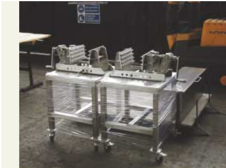
Trealamh d'Oifigí Tréidliachta

Oifigí Réigiúnacha Tréidliachta: Rinneadh bíseanna saotharlainne as cruach dhomheirgthe