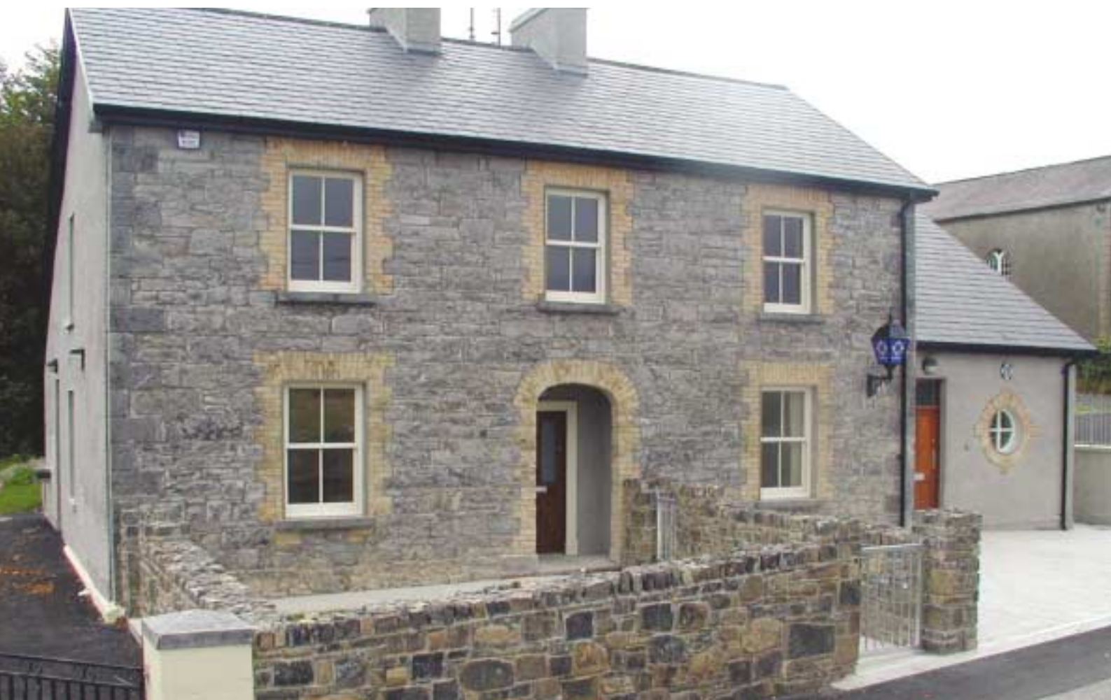
Staisiún na nGardaí, Riverstown, Co Sligeach.

Déanann an tAonad Bainistíochta Saoráidí forbhreithniú ar an bhforáil, trí sholáthróirí seirbhíse ar chonartha, de raon iomlán de sheirbhísí tacaíochta do mhaoine eile mar shampla na Saotharlanna nua Rialtais i mBackweston, Co. Chill Dara agus Ionad Cathrach an Taoibh Thuaidh, sa Chúlóg, Baile Átha Cliath. Is í an cuspóir atá acu foráil seirbhíse bainistíochta saoráidí atá gairmiúil, éifeachtach ar bhonn costais, agus ar scothchleachtas, a sholáthar do na Ranna gurb iad a gcliaint iad.