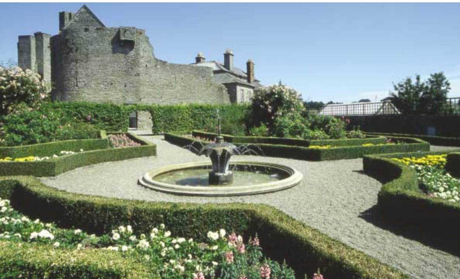
Caisleán Ros Cré

I Nollaig na bliana 2004 ghlac baill den Ghrúpa Bainistíochta Ealaine páirt chomh maith i nGrúpa Comhordaithe Idir-Rannaigh na hEalaine Poiblí ar a raibh an Roinn Ealaíon, Spóirt agus Turasóireachta mar chathaoir agus foilsíodh Ealaín Phoiblí: Scéim Céatadán don Ealaín, Treoirinte Ginearálta Náisiúnta dá bharr.