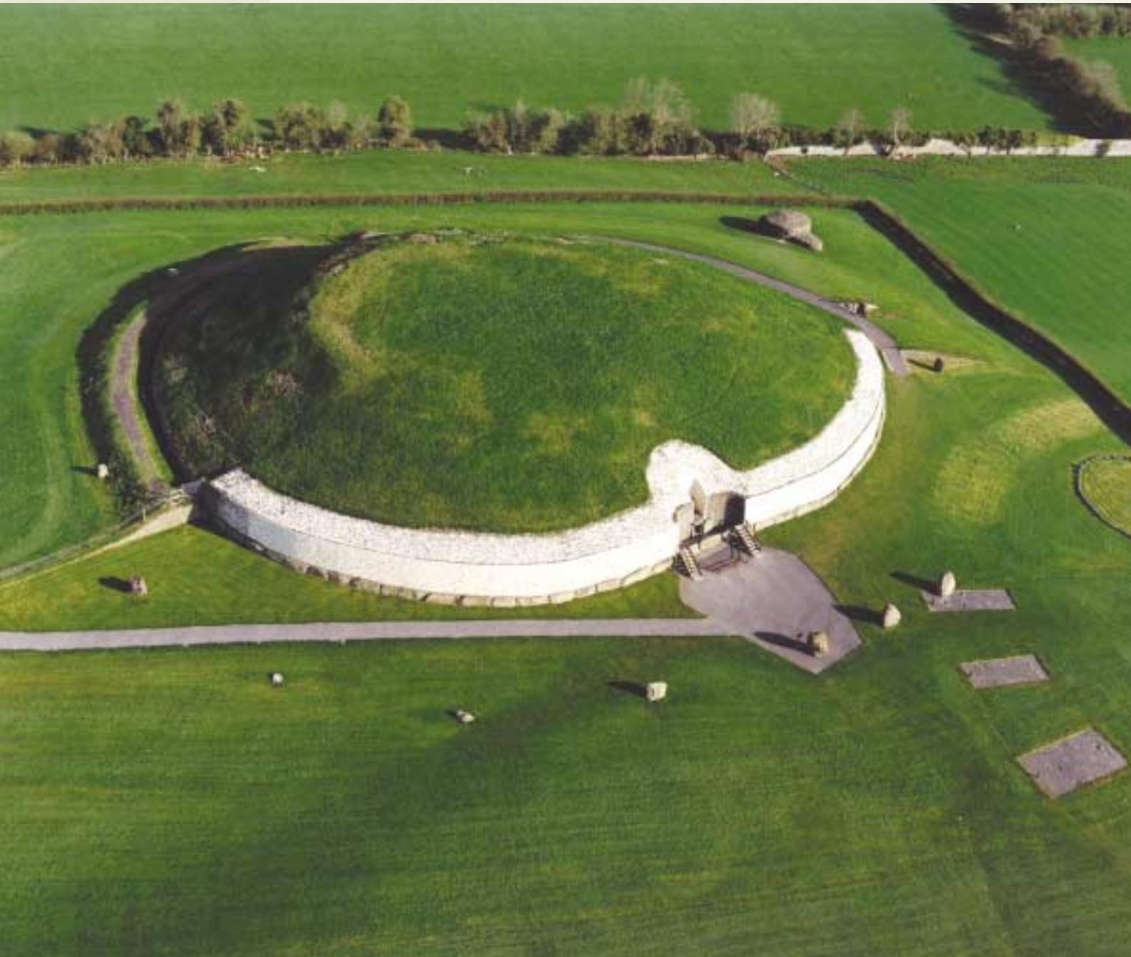
Brú na Bóinne