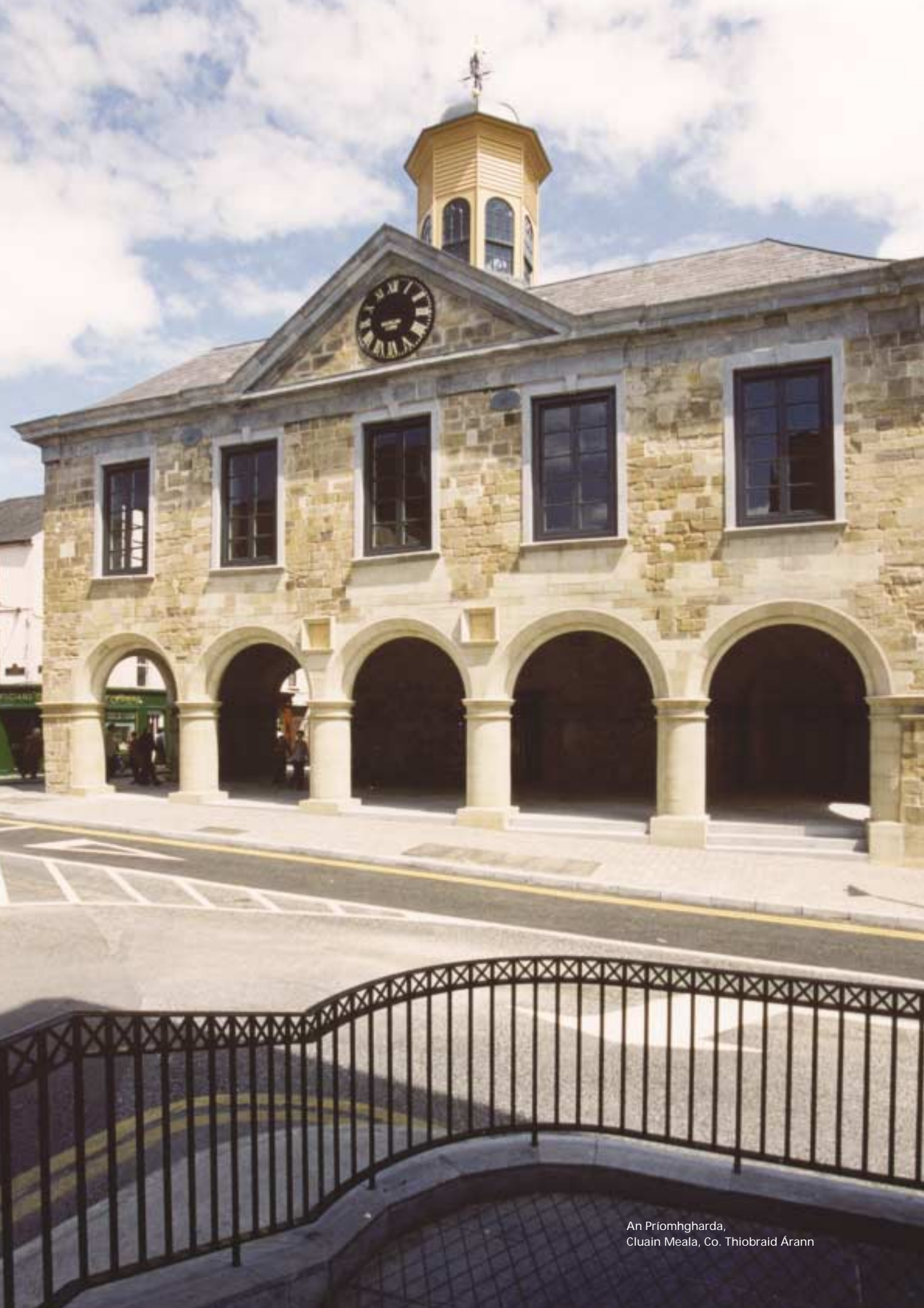
An Príomhgharda, Cluain Meala, Co. Thiobraid Árann