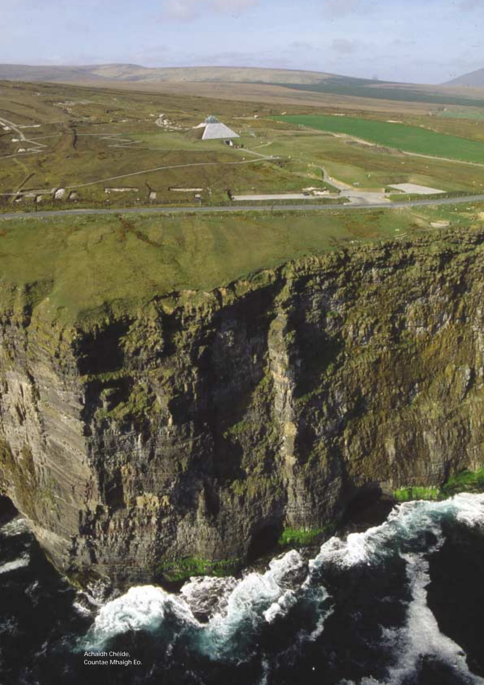
Achaidh Chéide, Contae Mhaigh Eo.