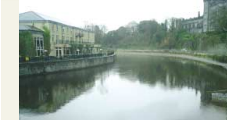
John'Droichead Eoin, Cill Chainnigh: síos an abhainn Droichead Eoin, Cill Chainnigh: suas an abhainn