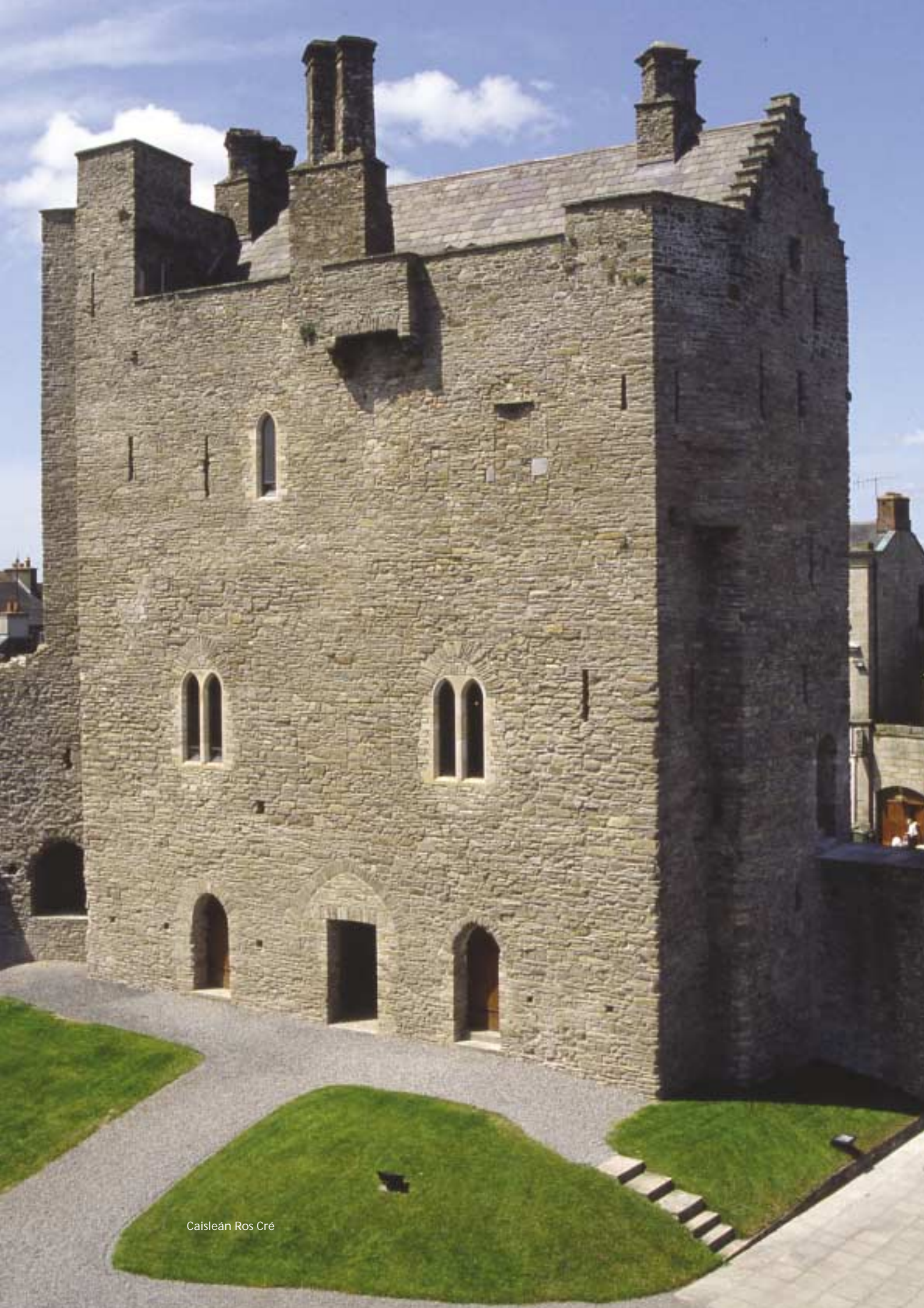
Caisleán Ros Cré