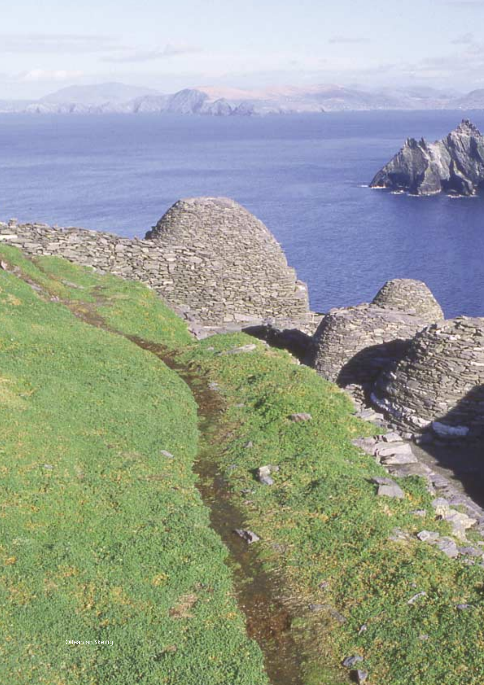
Oileán an Skeilig