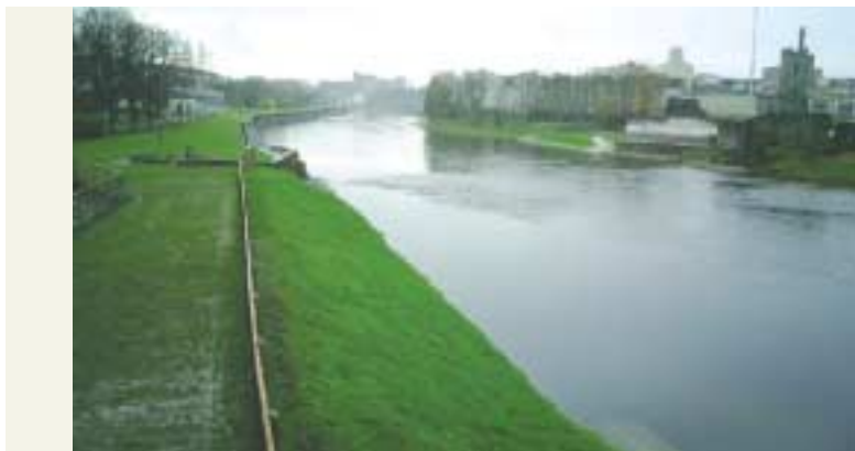
Droichead Uí Uaine, Cill Chainnigh: síos an abhainn

Tosaíodh ar na hoibreacha ar an Scéim Fóirithinte Tuilte ar An Fheoir (Cathair Chill Chainnigh) i mí Lúnasa 2001 agus tá siad ionann is críochnaithe anois. Dearadh an scéim sa chaoi is go mbeadh cosaint ann in aghaidh a leithéid sin de thuile is go mbeadh dóchúlacht de 1% ann go dtarlódh sí in aon bhliain ar bith.