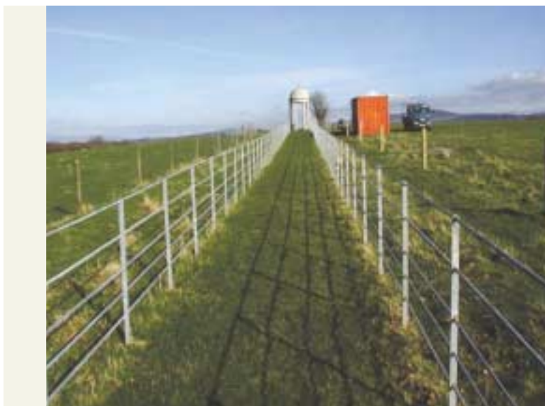
Ráillí Teach Altamont